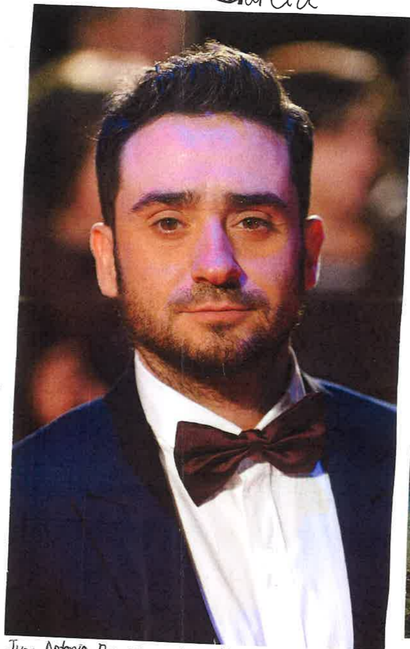
Juan Antonio Bayona nació en Barcelona, 9 de mayo de 1975. Es un director de cine y productor español. Es autor de películas como El orfanato (2007), Lo imposible (2012) y Un monstruo viene a verme (2016) en España, y fue elegido por Steven Spielberg para dirigir Jurassic World: El reino caído (2018). Inició su carrera dirigiendo anuncios de televisión y videoclips. En 2013 recibió el Premio Nacional de Cinematografía.

En diversas entrevistas ha nombrado a Stanley Kubrick, Alfred Hitchcock, Roman Polanski y Steven Spielberg como los realizadores que más han influido en su carrera como director.